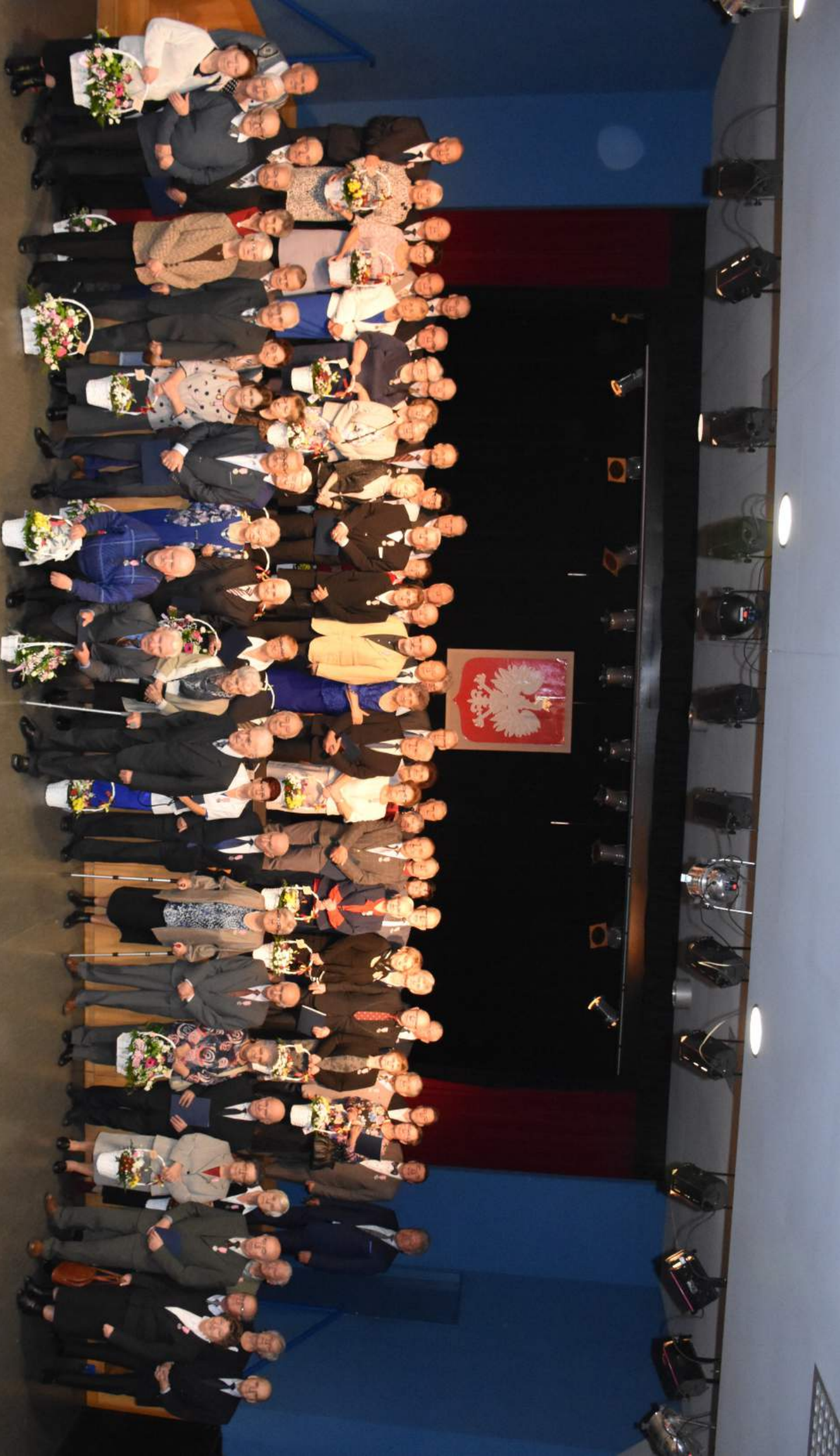
Jubileusz długoletniego pożycia małżeńskiego w Chetmku