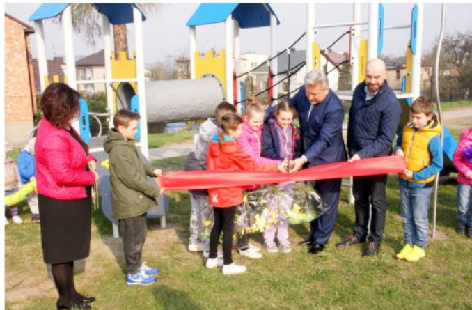
W ramach podziękowania najmłodszy przekazali zaproszonym gościom pamiątkowe dyplomy i upominki.

- Drodzy uczniowie, w minionym roku dorośli mieszkańcy Chełmka mieli okazję głosować na zadania, zaproponowane do realizacji w ramach Budżetu Obywatelskiego. I to właśnie dzięki im głosom, w tym także Waszych rodziców, dzisiaj otwieramy te nowoczesne urządzenia, które mam nadzieję, będą Wam służyły jak najdłużej. Dbajcie o nie, bawcie się na nich wspaniale, bo one zostały zainstalowane tutaj właśnie dla Was – mówił Burmistrz Andrzej Saternus.