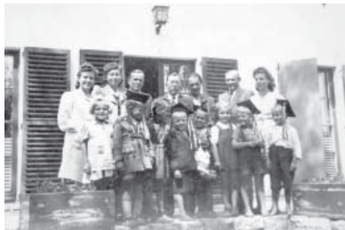
Przedszkolaki z wychowawczyniami, kierownictwem zakładu i osobami wizytującymi

Założenie przedszkola stało się jedną z ważniejszych spraw w tym czasie, aby dać początek wyciągania społeczeństwa z marazmu okupacji niemieckiej. W pierwszej połowie 1945 roku kierownictwo zakładu sfinansowało remont i przystosowanie do potrzeb przedszkola willi wybudowanej dla niemieckiego dyrektora zakładu, w malowniczym lesie obok kolonii. Zatrudniono przedszkolanki, które oprócz prac wychowawczych właściwych dla tego stopnia kształcenia dużo uwagi zwracały na kształtowanie polskiego patriotyzmu. Co charakterystyczne – zakład zaraz na początku zakupił kilka strojów krakowskich dla dziewcząt i chłopców z pawimi piórami, a krakowiak stał się podstawowym tańcem na różnego rodzaju spotkaniach i akademiach w Chełmku.