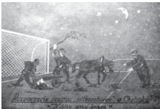
Nasza praca. Rozpoczęcie sezonu piłkarskiego „Kibice przy pracy”