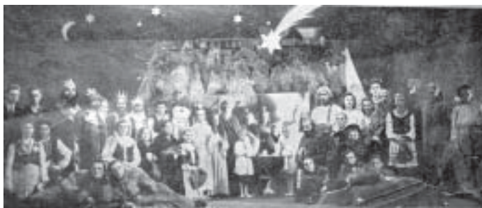
„Jasełka Polskie” na scenie w Chełmku