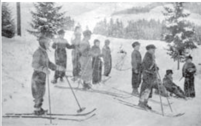
Zuchy na obozie w Rabce.