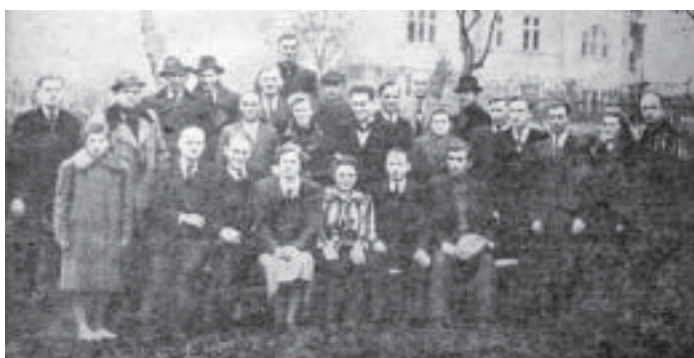
Pracownicy fabryki „Bata” na wczasach w Wiśle wraz z odwiedzającymi ich członkami kierownictwa.

W listopadzie 1945 roku zakład zorganizował pierwsze wczasy w Wiśle dla robotników zatrudnionych przy ciężkich pracach.