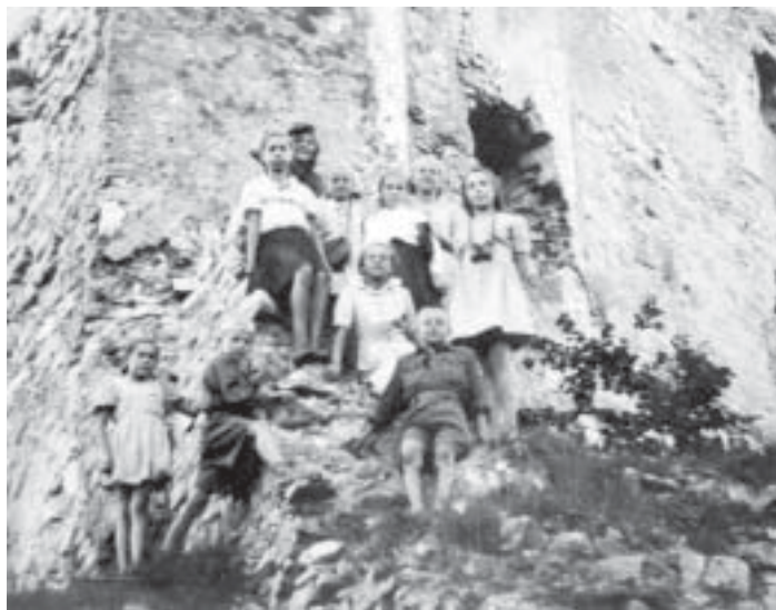
Na obozie harcerskim w Lipowcu.

Przez prawie pięć lat okupacji dzieci polskie pozbawione były prawdziwej radości, swobody i sportu. Dopiero po wojnie odzyskały prawo do działań, przynależne ich wiekowi. W krótkim czasie powstawały drużyny zachowe i harcerskie prowadzone przez bardzo oddanych drużynowych, organizujących liczne obozy finansowane przez fabrykę „Bata” - jako jeden z pierwszych pod ruinami zamku w Lipowcu, a później w Otmęcie, Rzykach i Targanicy.