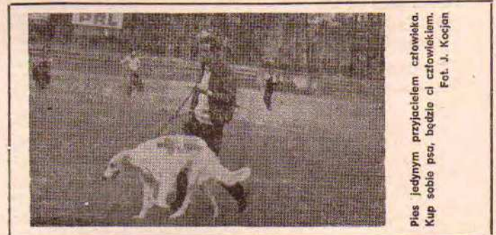
Pies jedynym przyjacielem człowieka. Kup sobie psa, będzie ci czuwałkiem.