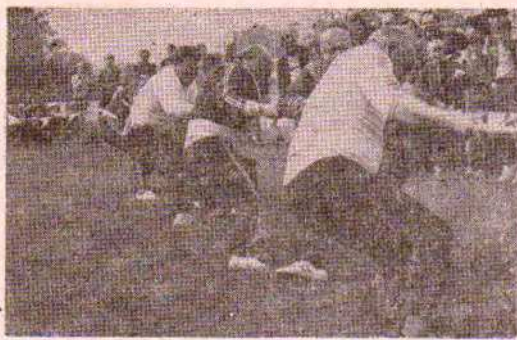
Duże emocje budziły wszystkie konkurencje.

chelmeckiego zakładu. Ponieważ wyniki Spartakiady dotarły do redakcji z dużym opóźnieniem, przekazujemy je naszym Czytelnikom w następnym numerze.