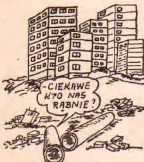
RYS. Z. DYSZCZYŃSKI-OB.