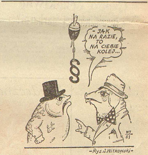
-Rys. J. Witkowski-

do samego wykonania? Nie, gdyż z dotychczasowymi koncepcjami zarządzania dopuszczalne są korekty planu w trakcie jego realizacji. Zmiany wartościowe mogą nastąpić jeszcze po ukazaniu się tego numeru, gdy sprawa-