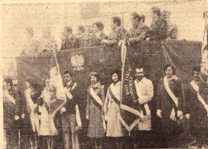
Przed trybuną honorową stanęły poczty szlandarowe zakładów pracy i organizacji społecznych.