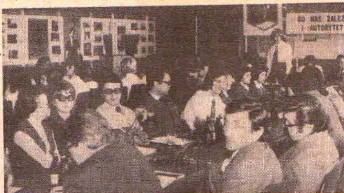
Na sali obrad i Konferencji Sprawozdawczo-wyborczej zakładowej organizacji ZSMP