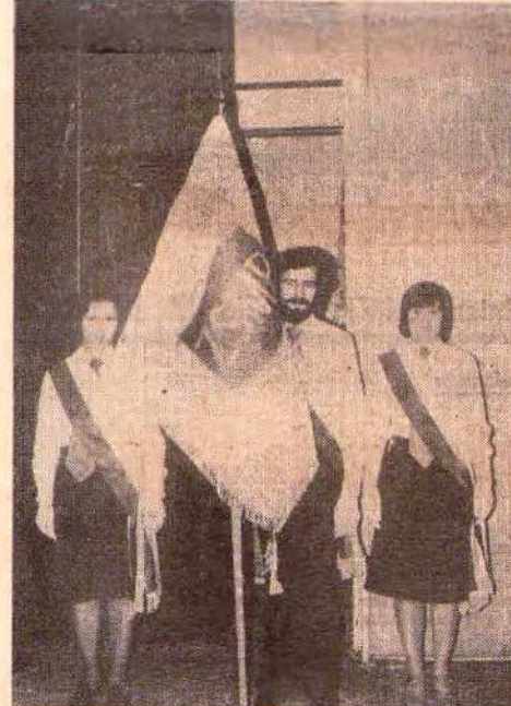
Nowy sztandar zakładowej organizacji ZSMP