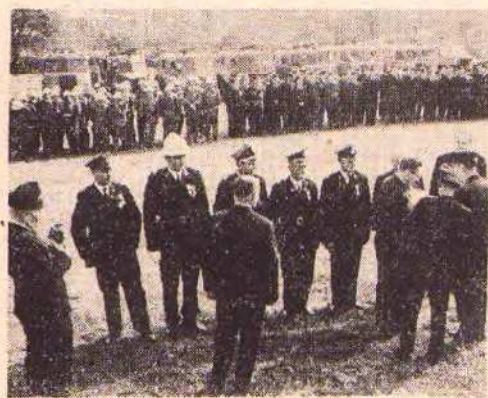
Dekorowanie zasłużonych strażaków