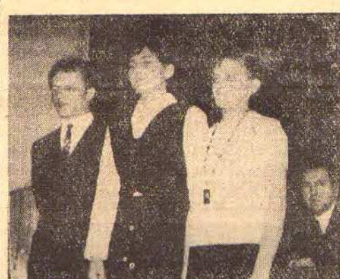
Oni to stali się szczęśliwymi posiadaczami legitymacji partyjnych nr 999, 1000 i 1001

W środę 12 bm. w sali widowiskowej PZS w Czelmeńku rozpoczęło się zebranie partyjne obejmujące 202 słuchaczy.