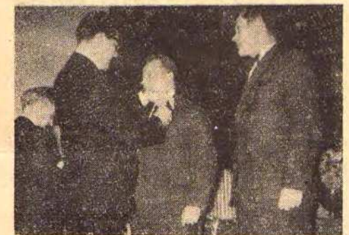
Dyr. Pactwa otrzymuje medal za zasługi dla obrony kraju