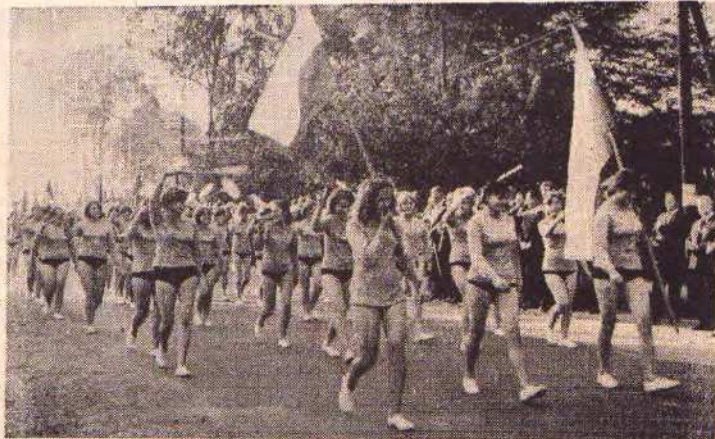
Kolumna sportowa w drodze na stadion