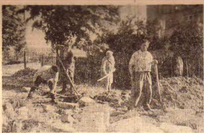
Grupa pracowników PZS przy budowie drogi Chelmek—Gorzów.

Związki zawodowe stoją na stanowisku kontynuowania polityki podwyższania rent, zwłaszcza najniższych w ramach ogólnych środków, przeznaczających przez państwo na poprawę materialnych warunków ludzi pracy. „Aktualności Związkowe”