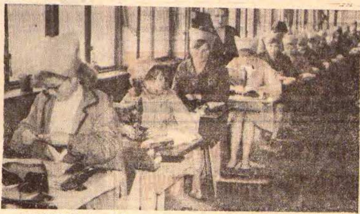
Brigada junaków zatrudnionych przy szyciu cholewek pro dukcji obuwia skórzanego.

Do obsługi bufetu w Ośrodku Kąpielowym w Chelmku — Paprotniku, zarząd KS „Chelmek” przyjmie odpowiedniego kandydata. Wynagrodzenie prowizyjne. Warunki pracy i płacy do omówienia w sekretariacie klubu w OKO (hotel robotniczy nr 35) codziennie z wyjątkiem niedziel i poniedziałków w godz. 18—19.