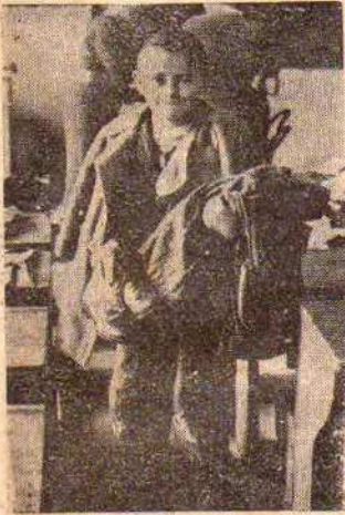
Na fotografii chłopczyk obdarowany odzieżą i obuwem z uśmiechem zadowolenia.

Komitet Rodzicielski przy Szkole powszechnej w Chełmku, podobnie jak w ub. roku i w obecnym, przyszedł z pomocą zimową dla dziatwy szkolnej, organizując zbiórkę odzieży. Akcja zbiórkowa wydała bardzo dobry wynik, dzięki poparciu mieszkańców Chełmka, to też w sobotę, 3 grudnia br. wiele dzieci szkolnych zostało obdarowanych odzieżą i obuwem.