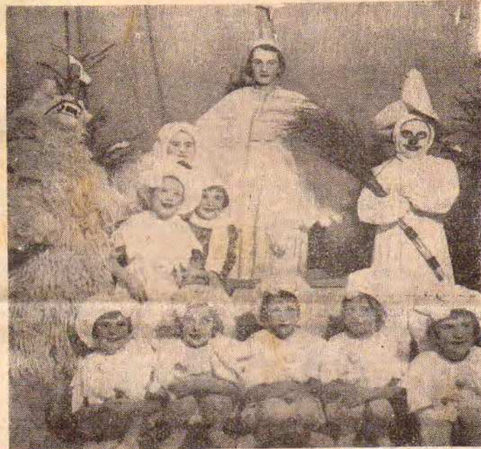
Zespół dzieci, które pięknie odegrały przedstawienie.