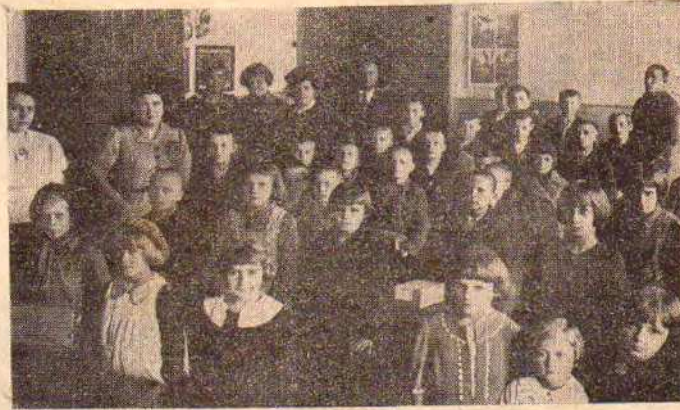
Dzieci w nowych ubrankach.

Komitet Rodzicielski przy Szkole powszechnej w Chełmku, podobnie jak w ub. roku i w obecnym, przyszedł z pomocą zimową dla dziatwy szkolnej, organizując zbiórkę odzieży. Akcja zbiórkowa wydała bardzo dobry wynik, dzięki poparciu mieszkańców Chełmka, to też w sobotę, 3 grudnia br. wiele dzieci szkolnych zostało obdarowanych odzieżą i obuwem.