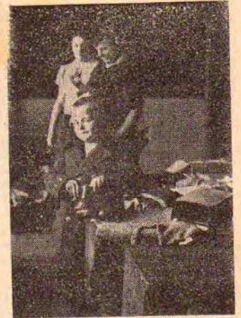
Na chwilę przed przymierneniem bucików.

W poniedziałek, 5 grudnia, dzieci szkolne wystąpiły w jadalni fabrycznej z przedstawieniem, które zgromadziło co najmniej tysiąc od najmłodszych do najstarszych obywateli Chełmka. Dzieci odegrały przedstawienie b. ładnie, czego dowodem były huczne brawa. — Po przedstawieniu zjawił się na scenie św. Mikołaj z kilkuset podarkami, które wszystkie porozdawał, a dzieci w zamian za to przyrzekły poprawę, by św. Mikołaj i w przyszłym roku nie ominął Chełmka.