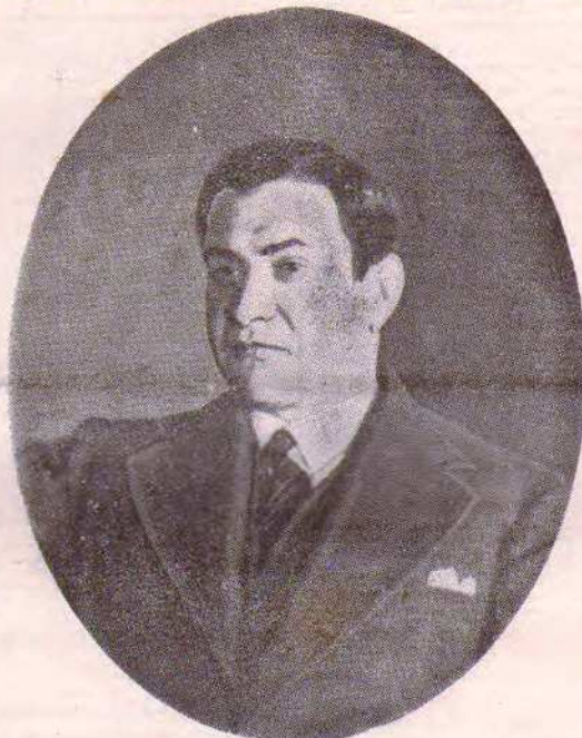
Ś. p. general brygady Bronisław Pieracki

Na znak żałoby proszę o jednominutową chwilę milczenia”. Wst-