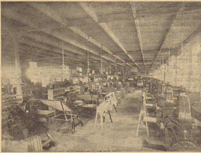
Hala manipulacyjna naszych Zakładów w Chełmku.