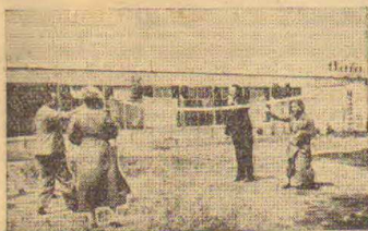
Jak spędzają nasi pracownicy wolne chwile.

Mecz tenisowy kobiety Polska — Niemcy wygrała drużyna polska w stosunku 3:2. Głównie do wygranej drużyny polskiej przyczyniła się mistrzyni Polskiej Jędrzejowska.