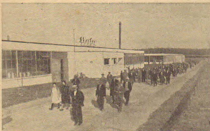
W porze obiadowej spieszą pracownicy nasi do wspólnej jadalni naszej.