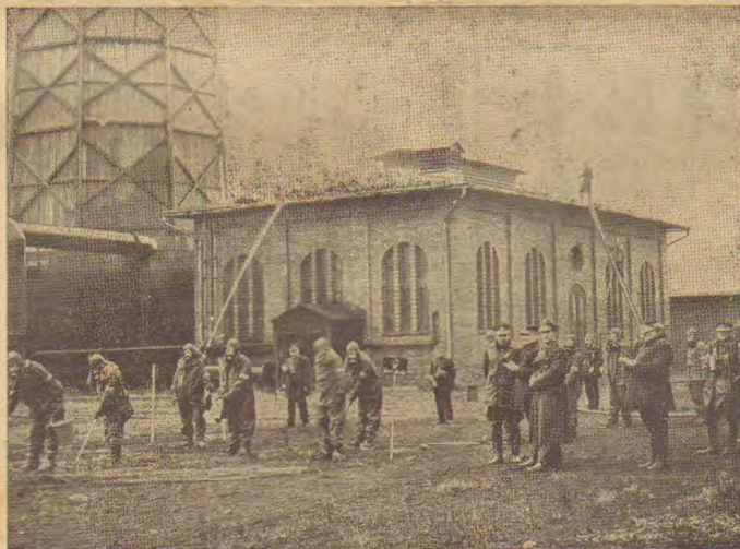
Kurs gazowy pod kierunkiem kpt. Lewickiego.