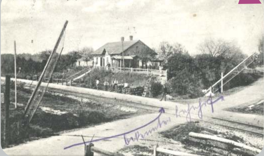
Chelmek. Dworzec kolejowy. Bahnhof.

Wykonaj fotografię na tle figury znajdującej się przy kościele oraz odpowiedz na pytanie kogo ona przedstawia? Odpowiedź będzie hasłem, które podajecie w Domu Ludowym, aby otrzymać pieczęć.