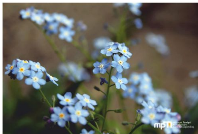
Przy domu w Łękach-Zasolu, w którym podczas wojny mieszkała rodzina Dusików dziś rośnie mnóstwo niezapominajek.

Dziś przy domu, w którym Dusikowie mieszkali podczas wojny rośnie mnóstwo niezapominajek.