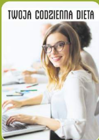
TWOJA CODZIENNA DIETA