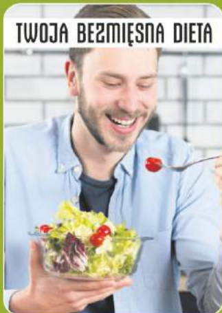
TWOJA BEZMIĘSNA DIETA