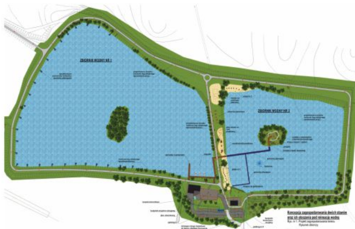
Koncepcja zagospodarowania kompleksu rekreacyjnego „Stawy” w Chełmku.