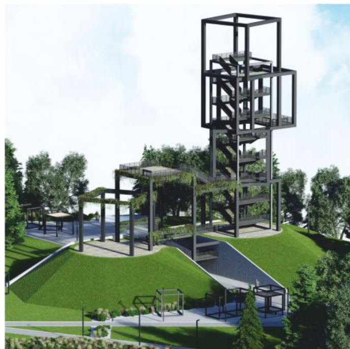
Koncepcja wieży widokowej im. rtm. Witolda Pileckiego na wzgórzu Skała.