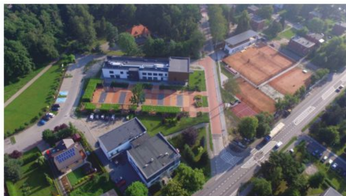
Biblioteka i korty tenisowe - widok z lotu ptaka.

W budynku po dawnym przedszkolu w Chełmku powstała biblioteka wraz ze świetlicą środowiskową, a jej otoczenie zostało uporządkowane i odnowione. W budynku powstały między innymi: sale do zajęć warsztatowych, pozalekcyjnych, sale zabaw, sale multimedialne, biblioteka z czytelnią ogólną, naukową i dla młodzieży, świetlica dla dzieci oraz klubokawiarnia.