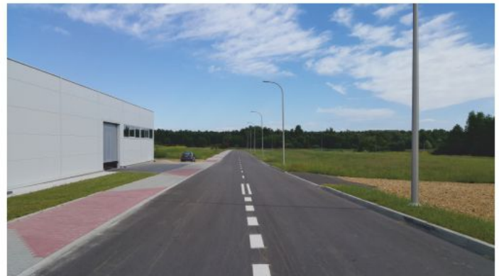
Ulica Unii Europejskiej w Chełmku.

Na skutek realizacji projektu pn.: „Zwiększenie dostępności do terenów przemysłowych w Chełmku – budowa dróg dojazdowych do strefy” powstała droga dojazdowa do strefy inwestycyjnej – ulica Unii Europejskiej. Przyczyni się ona do poprawy i rozwoju sieci komunikacyjnej obsługującej obszary położone w Miejskiej Strefie Aktywności Gospodarczej o powierzchni około 31 ha, około 12 ha gminnych terenów inwestycyjnych należących do Podstrefy Chełmek w Krakowskiej Specjalnej Strefie Ekonomicznej oraz kolejnych 13 ha znajdujących się wzdłuż nowo wybudowanej drogi.