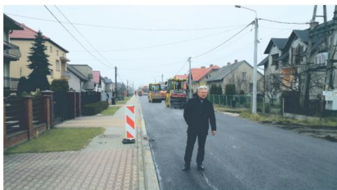
Budowa kanalizacji sanitarnej w ulicy Nadwiślańskiej w Bobrku.

Na realizację tego projektu poniesiono łącznie nakłady brutto w wysokości: 3 853 290,98 zł. W ramach niego wybudowano do końca 2020 roku 2,5 km kanalizacji sanitarnej oraz zmodernizowano 426 metrów sieci wodociągowej. Do sieci kanalizacji sanitarnej podłączono 312 nowych użytkowników. Projekt został dofinansowany ze środków Unii Europejskiej do końca 2020 roku kwotą 2 117 944,23 zł, w tym 18 454,66 zł w 2020 roku.