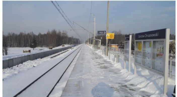
Modernizowana linia kolejowa nr 93 w Gorzowie.

Ponadto od ubiegłego roku na terenie Naszej gminy prowadzona jest modernizacja linii kolejowej nr 93 Trzebinia – Zebrzydowice. Poza samą