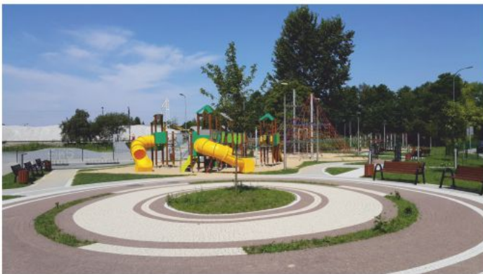
Skwer Dzieci i Młodzieży przy ul. Kolejowej w Chełmku.

W ramach zadania został utworzony ogólnodostępny skwer dla dzieci i młodzieży zawierający między innymi: skate park, park linowy z wyposażeniem, plac zabaw, oświetlenie oraz elementy małej architektury takie jak min.: ławki, kosze na śmieci, stojaki rowerowe.