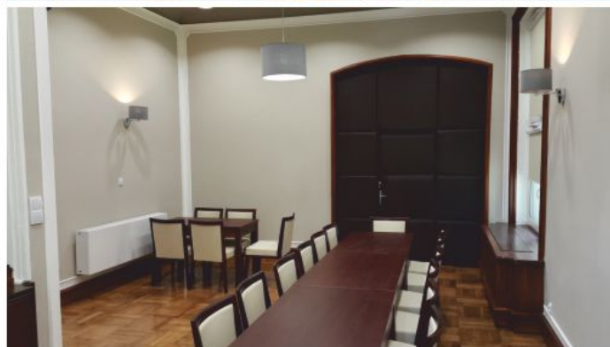
Dom Seniora w Chełmku