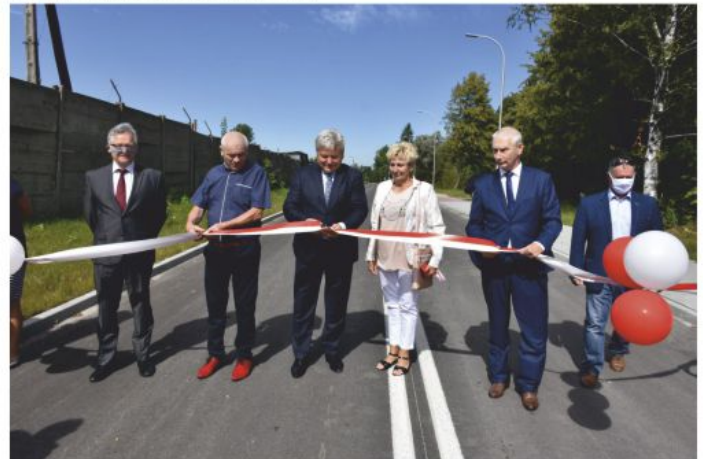
Otwarcie ul. Unii Europejskiej.

W zakresie gospodarki wodno-ściekowej w 2020 roku prowadziliśmy zadania inwestycyjne – projekty dotyczące rozbudowy sieci kanalizacji grawitacyjno-tłocznej w ramach Programu Infrastruktura i Środowisko 2014-2020 tj.: