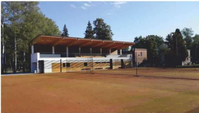
Korty tenisowe po zrealizowaniu projektu.