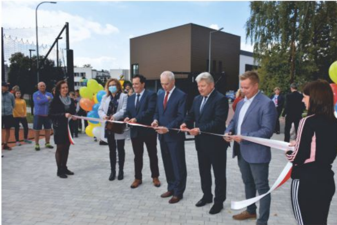
Uroczyste otwarcie kortów tenisowych.

W ramach zadania został przebudowany kompleks kortów tenisowych wraz z budową zaplecza szatniowo-socjalnego przy ulicy Brzozowej w Chełmku. Zostały zmodernizowane: trybuny, ścianka treningowa z kortem o nawierzchni poliuretanowej oraz korty o nawierzchni z mączki ceglanej.