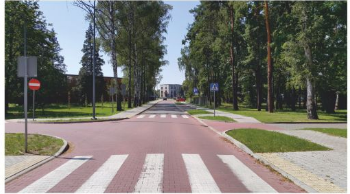
Ulica Brzozowa w Chełmku.

poprawiło dostępność komunikacyjną obiektów zrealizowanych w ramach całego projektu.