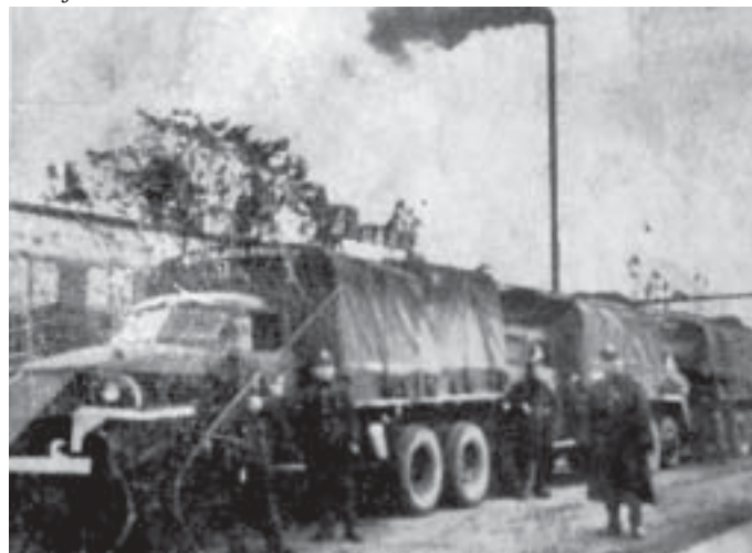
Kolumna wojskowych samochodów, które przybyły po odbiór obuwia.

W marcu, przy stanie zatrudnienia 1319 pracowników, wyprodukowano 52 625 par obuwia – był to pierwszy normalny miesiąc produkcji.