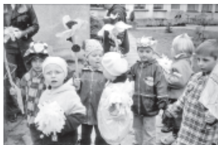
„Zielony pochód” przedszkolaków

Maraton trwał cały dzień. Dzieci z grup zerowych odegrały przedstawienie o życiu w lesie. Przebrane za drzewa, kwiaty, zwierzęta i ekoludki (stroje wykonali rodzice) przedszkolaki opowiadały jak należy się zachowywać w lesie i co należy robić ze śmieciami. Były też konkursy i zagadki ekologiczne. Było to przedstawienie dzieci dla dzieci, ale zobaczyli je też rodzice w specjalnym pokazie. W ramach maratonu odbyło się też uroczyste sadzenie drzew i kwiatów wokół przedszkola, poprzedzone uroczystym przyrzeczeniem o szanowaniu przyrody. Dzieci z całego przedszkola wzięły udział w „zielonym marszu” prowadzącym ulicami Chełmka. Specjalne plakaty przygotowane z tej okazji miały przypomnieć mieszkańcom, że my sami odpowiadamy za stan naszego środowiska. W ten