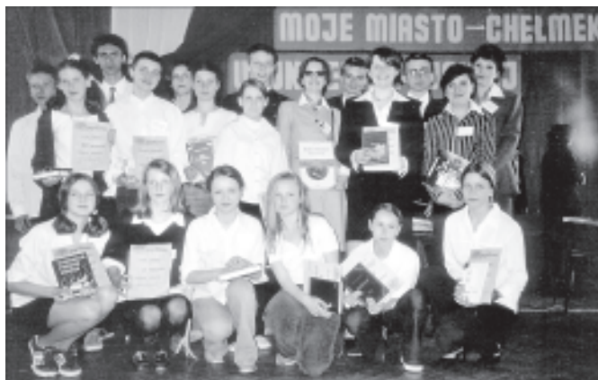
Uczestnicy konkursu wiedzy o UE