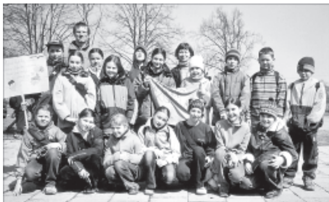
Uczestnicy rajdu z Chełmka