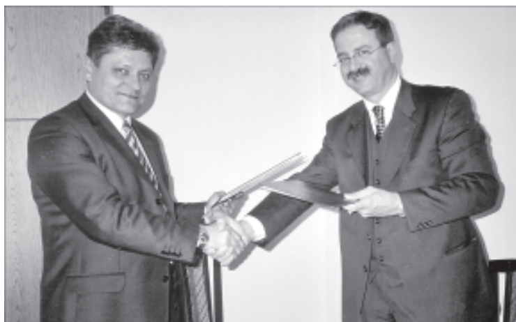
Wymiana listów intencyjnych

Pojawienie się takiego przedsiębiorcy na terenie gminy może pomóc zrealizować przyjęty Program Ożywienia Gospodarczego, jednak firma nie podjęła jeszcze ostatecznej decyzji o lokalizacji swojego zakładu. Zdaję sobie sprawę jakie ta informacja może wywołać skutki, dlatego w celu ostudzenia zapałów przypominam, że to są na razie tylko rozmowy, wyrażanie pewnej woli, natomiast decyzje w tej kwestii podejmie strona włoska i musimy się uzbroić w cierpliwość- mówi burmistrz- Myślę, że terminem podjęcia ostatecznej decyzji będzie połowa maja- tak wynikało z rozmów. BKC