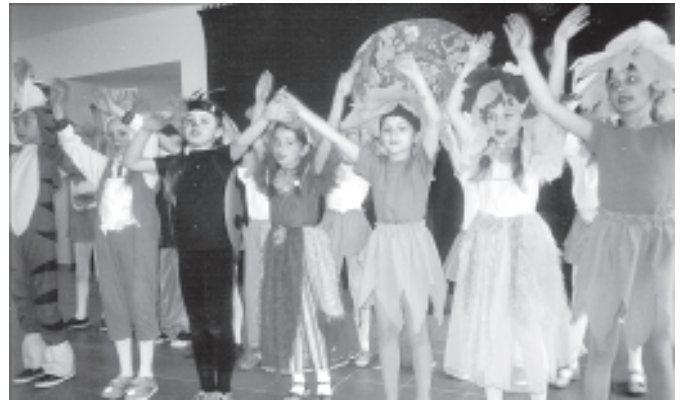
Obchody Dnia Ziemi w SP nr 2 w Chełmku

Szkoła Podstawowa nr 2 w Chełmku obchody Dnia Ziemi realizowała w oparciu o projekt ekologiczny pt.: „Wszyscy odpowiadamy za naszą planetę”, przygotowany przez nauczycieli. Przeprowadzono akcje sprzątania, połączone z segregacją śmieci, zorganizowano też zbiórkę surowców wtórnych. Odbyły się konkursy przyrodnicze: „Omnibus ekologiczny”, „Moje ulubione zwierzę” (zwierzęta wykonane z modeliny, gipsu i gliny można zobaczyć w pracowni przyrodniczej) i „Przyroda moim domem”. Jak co roku uczniowie maszerowali ulicami miasta, prezentując ekologiczne hasła. Wspólnie z MOKSiR przeprowadzono akcję ekologiczno-plastyczną „Śmiecio-drzewa”. Uczniowie z klas piątych ze swoimi wychowawcami C. Rudyk i U. Kowalską wykonali „drzewa” ze sztucznych i naturalnych odpadów. Efekty pracy można zobaczyć na wystawie w MOKSiR. Podsumowaniem wszystkich działań związanych ze świętem Ziemi była