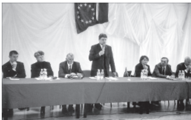
Gminne spotkanie europejskie

Po wysłuchaniu przemówień głos zabrali mieszkańcy Chełmka. Zarówno sceptycy, jak i zwolennicy wstąpienia naszego kraju do Unii Europejskiej. Ludzie pytali jakie i ile środków Polska może uzyskać, ile będzie kosztowała akcesja z Unią. Szacuje się, że w pierwszych latach po wstąpieniu można będzie uzyskać nawet do 20 mld euro. Jednak nie wiadomo ile procent tych środków uda się wchłonąć. Pytania dotyczyły też wzrostu cen, sytuacji rencistów i emerytów, spraw związanych z lecznictwem i zabezpieczeniami socjalnymi.